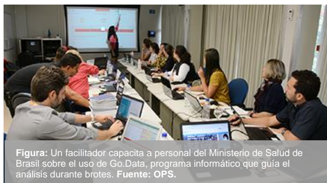
Figura: Un facilitador capacita a personal del Ministerio de Salud de Brasil sobre el uso de Go.Data, programa informático que guía el análisis durante brotes.

En previsión de la importación de casos y la transmisión en la comunidad, las representaciones de la OPS en Cuba, Haití y Panamá han ayudado a aumentar la capacidad de los equipos nacionales de vigilancia y análisis epidemiológicos. Los equipos técnicos de la OPS en los países están trabajando junto con homólogos del ministerio de salud para evaluar los datos de vigilancia a fin de orientar los recursos y tomar medidas de salud pública sobre la base de diferentes modelos de brote y la disposición operativa de los hospitales. El equipo de Brasil facilitó un taller de capacitación sobre el uso de Go.Data (10 de marzo, Brasilia). El equipo de Costa Rica colaboró con homólogos para producir y analizar modelos de enfermedades y su posible impacto en los sistemas locales de salud de los países. El equipo de Suriname está colaborando con homólogos del BID con el fin de proporcionar suministros, capacitación y el equipo necesarios para establecer sistemas de recopilación de datos.